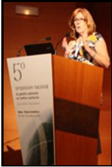
"Redução de resíduos Hospitalares Perigosos". Hospital Professor Doutor Fernando Fonseca, EPE. Amadora, Portugal.