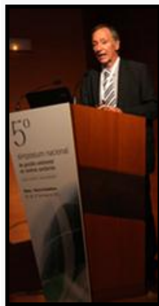
"Integración de la RSC en la estrategia del Hospital Galdakao-Usansolo" Hospital Galdakao-Usansolo. Bilbao, España.