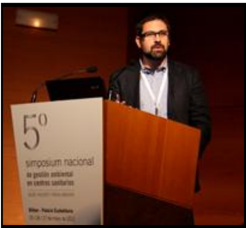
"Evaluación de la aplicación de producto SC48 para el ahorro de combustible en Vehículos Sanitarios de Emergencias de EPES". Empresa Pública de Emergencias Sanitarias. Málaga, España.